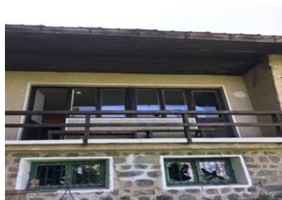
Разрушена фасада и прозорци на хижа „Есперанто“