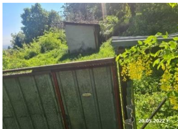
Незаконна постройка ул. „Беловодски път“

в) При извършването на проверките от междуведомствената работна група през 2019 г., на ул. „Беловодски път“, на територията на ПП „Витоша“ е установена едноетажна постройка, формирана от 3 бр. павилиона, поставени един до друг с обща дължина от 18 м. и ширина от 3 м. с общ еднокатен ламаринен покрив. Постройката е електро- и водоснабдена и е определена от заместник-кмета на район „Витоша“ през 2020 г. като незаконна по смисъла на чл. 7а от Закона за устройството на територията, тъй като за построяването ѝ и въвеждането ѝ в експлоатация не са издадени съответните разрешителни. При проверката във връзка с одита, незаконната постройка все още не е премахната. 413