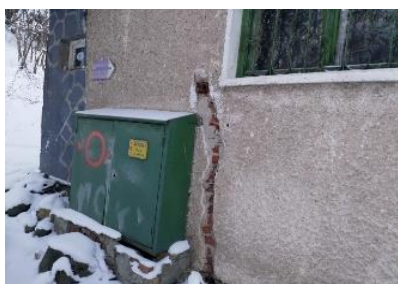
Прекъснато електричество на хижа „Есперанто“

Проверената Хижа „Есперанто“ 404 е в лошо състояние, необитаема, рушаща се и опасна за околната среда и здравето на туристите. 405