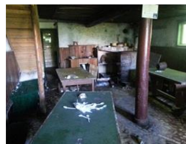
Вътрешно състояние на хижа „Есперанто“

От туристическо дружество „Есперанто“ през 2020 г. е направено инвестиционно предложение за реновиране, стопанисване и поддържане на хижа „Есперанто“ до министъра на земеделието, храните и горите и директора на ЮЗДП и е заявено намерение за стопанисване на хижата под наем, предвид обстоятелството, че е построена от Софийската организация на българските есперантисти. 406