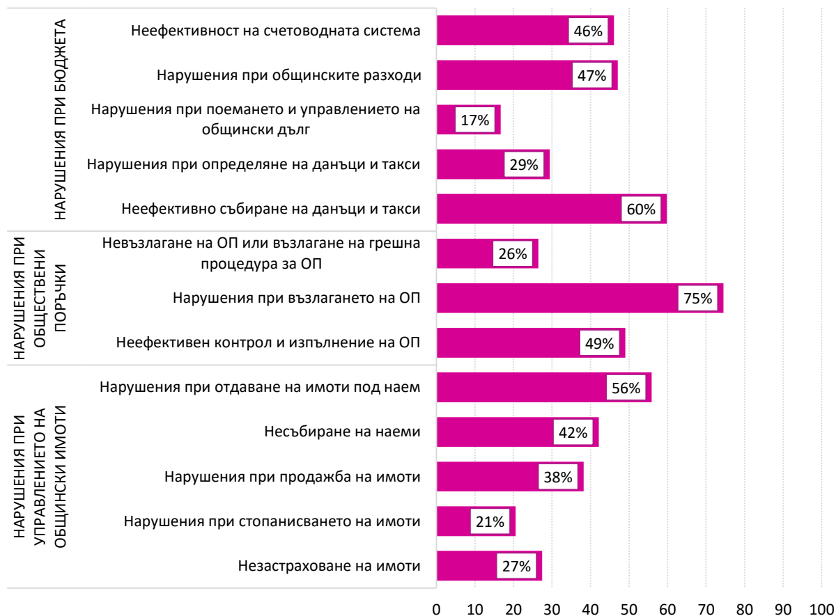
Открити нарушения и пропуски в работата на общините по видове, дял (%)

Най-често идентифицираните нарушения са в областта на възлагането на обществените поръчки, като почти три четвърти от общините (76 на брой) допускат някакви пропуски в тази дейност. Немалка част от общините имат проблеми при събирането на местните данъци и такси (60%, или 61 на брой) и при отдаването на общинските имоти под наем (56%, или 57 на брой), т.е. бихме могли да кажем, че това са най-проблемните дейности на местно ниво, предвид големия брой установени пропуски. Същата логика е трудно да се приложи при по-редките нарушения, като например тези в сферата на възникването и управлението на общинския дълг, тъй като малка част от одитите – едва осем – разглеждат тази област на управление на общинските финанси.