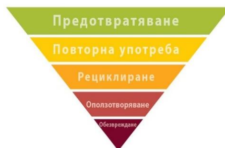
Фигура № 1

Компетентните органи по ЗУО и лицата, при чиято дейност се образуват и/или третират 167 отпадъци, са задължени да прилагат регламентирания приоритетен ред (йерархия) при управлението на отпадъците 168 , съобразен с общите принципи за опазване на околната среда 169 и предприемат мерки насочени към оползотворяване на отпадъците в съответствие с йерархията и при спазване на изискванията за предотвратяване или намаляване на вредното им въздействие върху човешкото здраве и околната среда. 170