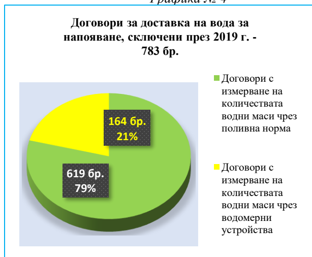
Графика № 4