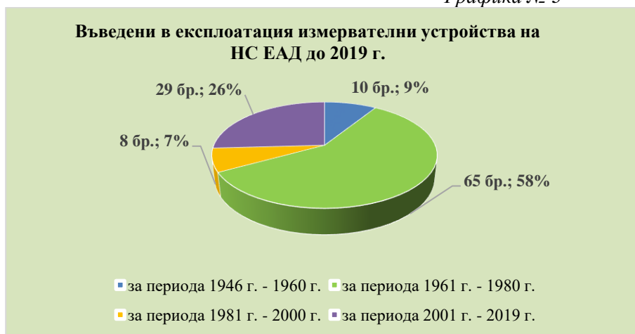
Графика № 3